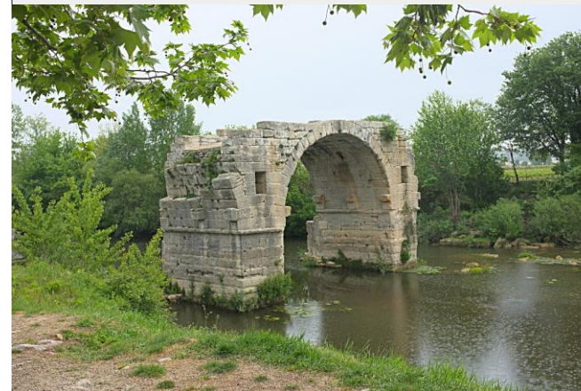
Le pont Ambroix

La trace GPS est accessible au format .gpx sur le site de l'ARALR www.aralr.fr