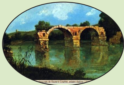
Tableau de G. Courbet Musée Fabre de Montpellier