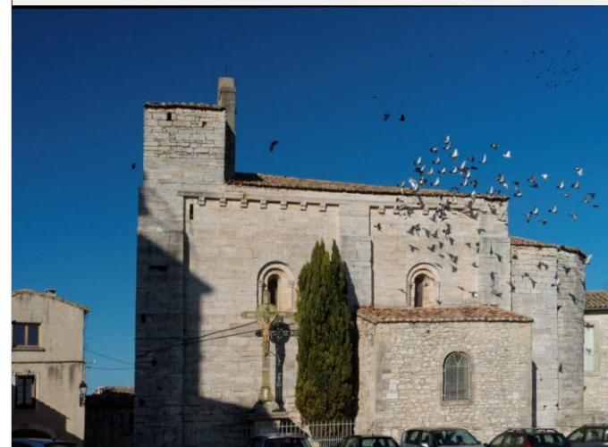
Saussines: Eglise Saint Etienne

La trace GPS est accessible sur le site www.aralr.fr à la rubrique correspondant aux itinéraires.