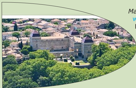
Vue générale de l'aqueduc et du château

Pas d'accueil avec chevaux référencé. Voir Office du tourisme Castries www.castries-tourisme.fr