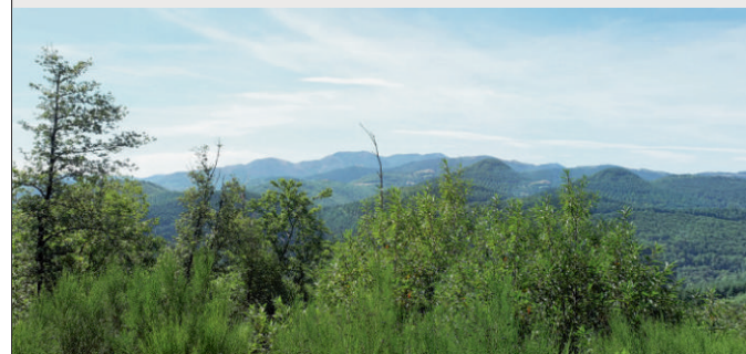
Vue depuis le col de la Bergère

Le départ peut se faire depuis le parking en bordure du plan d'eau du Boulloc ou sur l'espace naturel dégagé après les gîtes.